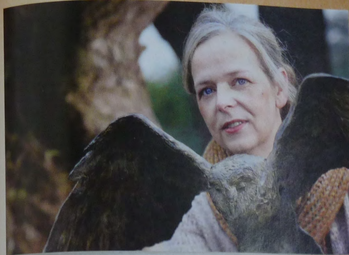
"Mijn beelden zijn herkenbaar."

eruitziet. Je hebt echt niet het hele lichaam nodig om duidelijk te maken welke soort het is." Jeanettes eigen nieuwsgierigheid speelt ook een rol. "Soms ben ik zo ontzettend benieuwd naar het beeld, naar hoe het gaat worden. Dan werk ik snel en laat ik automatisch delen weg. Ik bekijk daarna natuurlijk wel of de lijnen kloppen." Hoeveel een dier mist, hangt af van de positie. "Het moet wel mooi blijven. Kijk