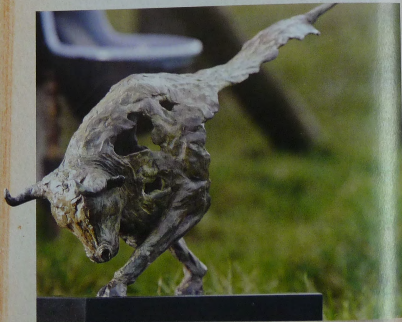
"Doordat de achterkant weg is, lijkt hij krachtiger."